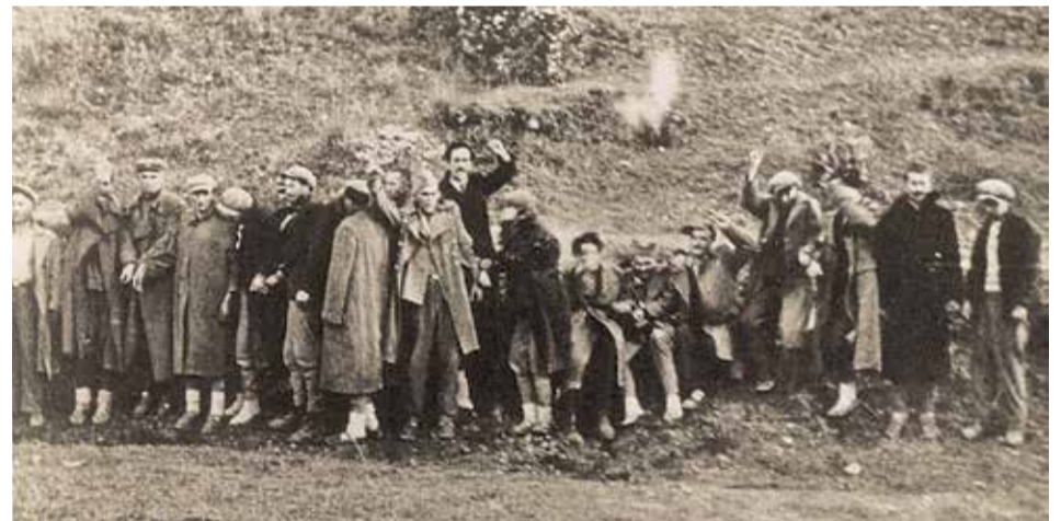
Бабий Яр. Расстрел гражданских лиц и партизан. Фото - 1944 год.