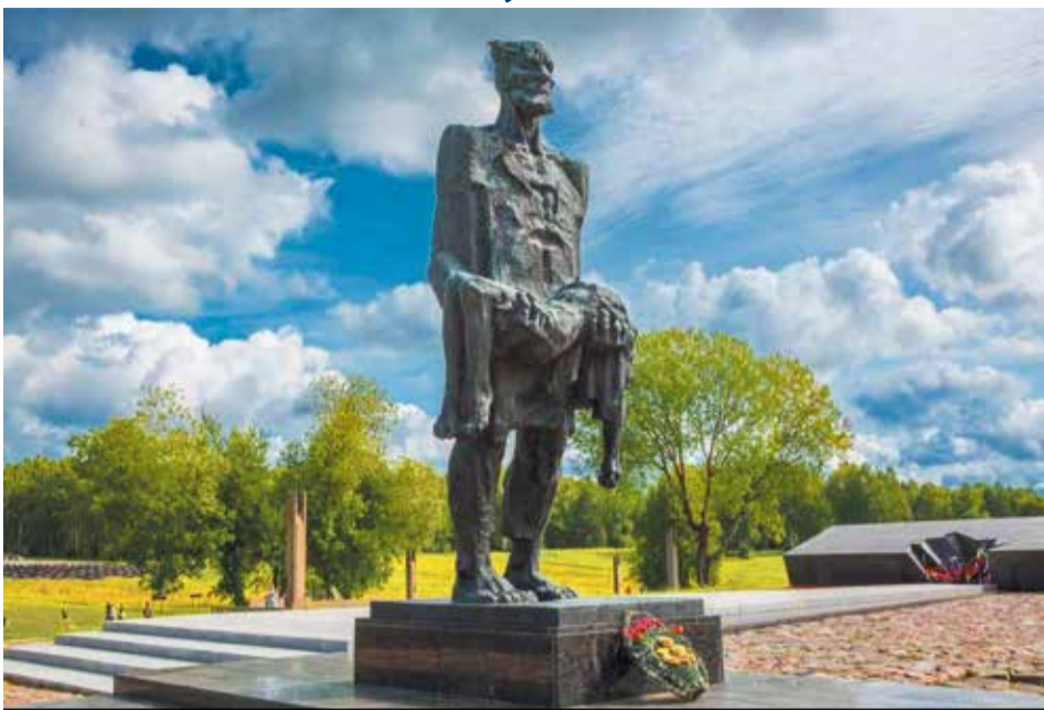
Государственный мемориальный комплекс «Хатынь»

Воронежский областной суд приступил к допросу экспертов по делу о геноциде нацистов в Воронежской области в 1942-43 годах. По данным Воронежского облсуда, возбуждено уголовное дело по ст. 357 УК РФ («Геноцид»). В деле заявлены около 20 экспертов, среди них очевидцы тех событий, историки, узники концлагерей.