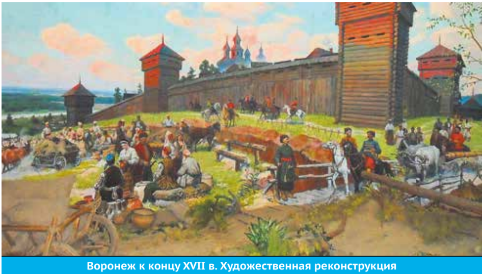
Воронеж к концу XVII в. Художественная реконструкция

История названия российского города Воронежа очень запутана, и её однозначного толкования на сегодняшний день не существует. Версий происхождения слова «Воронеж» много, и споры вокруг происхождения названия нашего родного города не утихают в ученом мире. Первое, что приходит в голову и что наверняка любой воронежец расскажет, - это легенда о воронах и ежах, которые в большом количестве водились в наших краях и в честь которых древние славяне назвали речку и город. Конечно, такая наивная версия не могла удовлетворить краеведов. В настоящее время существует несколько более или менее убедительных теорий.